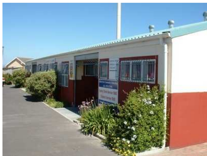
Batiment de l'association à Khayelitsha

L'association bénéficie de soutiens financiers de renom : JP Morgan Chase bank ; Nelson Mandela Children's Fund ; De Beers Fund ; Microsoft SA ; KPMG Inc ; Foschini Services ; Anglo American Chairman's Fund... gage du sérieux et de l'efficacité de l'association Learn to Earn.