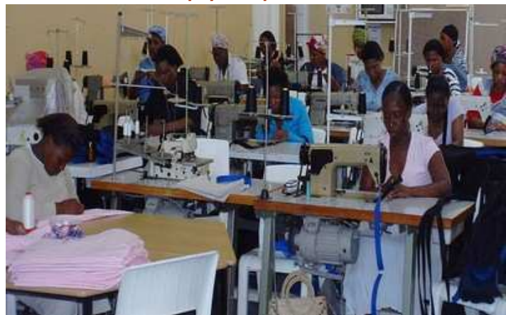
Atelier à Khayelitsha

Le but est d'éviter à ces personnes en difficulté le chômage et toutes autres formes d'injustice.