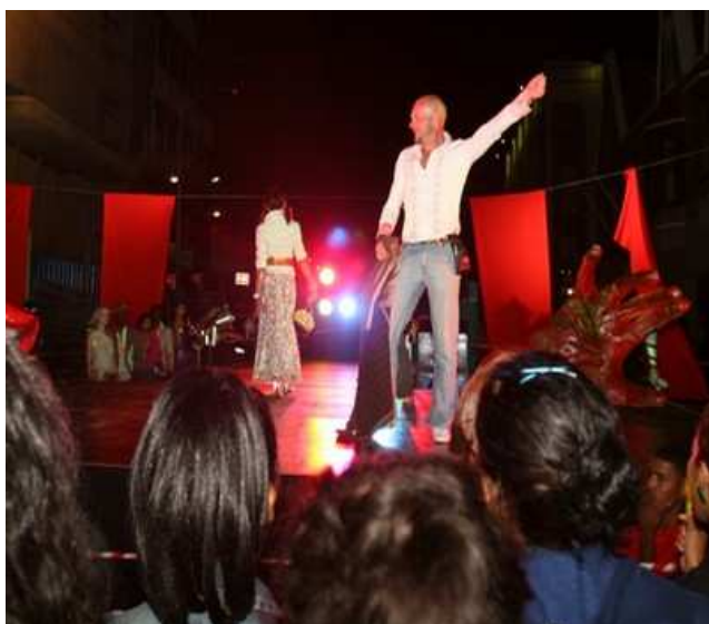
Défilé de Mode